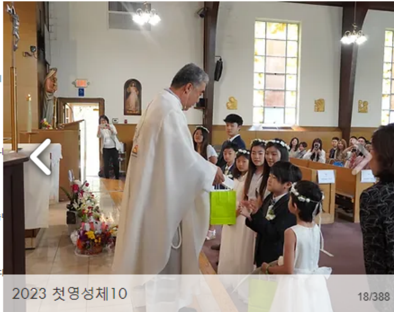
2023 첫영성체 10